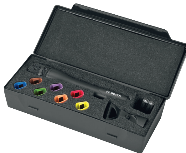
Futerał ochronny na mikrofon bezprzewodowy, ręczny i akcesoria