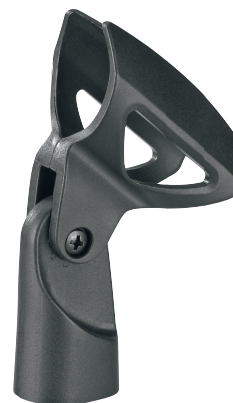
Szczegółowy widok uchwyty mikrofonu